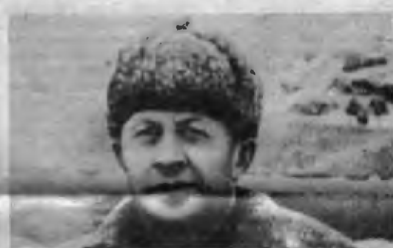
Kent merkezini savunan 13. Muhafız Birliği'nin komutanı General Rodimtsev

Bugün Türkiye'de Nazizm başkaldırdı. Tarihin en iğrenç baskı düzenini ülkeye getirmeye çalışıyor. Başta işçi sınıfımız, tüm halk, tüm devrimciler bu büyük tehlikeye karşı savaşıyor. Stalingrad utkusunun 35. yıldönümünde, şehitleri ve gazileri bu anti-faşist savaşımızın ateşiyle, saygıyla selâmlıyoruz. Onların tutkulu, yiğit savaşından, utkusundan ders, güç alıyoruz. Anları bize önder olsun!