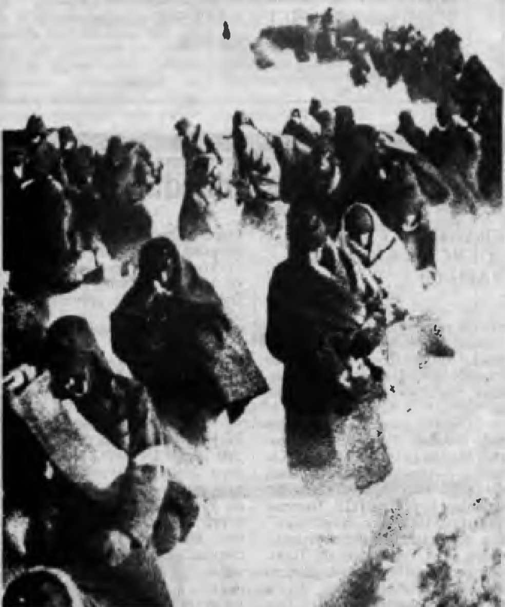
2 Şubat 1943 günü Sovyet orduları Stalingradı kuşatan