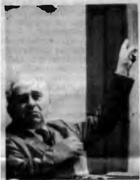
İKP Başkanı Luigi Longo

münizmi” için “sahte bir formül” dedi. Ekim devrimi için ise, “yalnızca sözde değil, gerçekte büyük bir kazanımdır. Kim ne derse desin, Rus devrimi hem Sovyetler Birliği, hem de tüm dünya için demokratik ve ilerici bir itici güç oldu. Dünyada böyle büyük bir ekonomik, politik, askersel ve ideolojik güç olmasaydı ne olurdu, bunu düşlemek kolay” dedi.