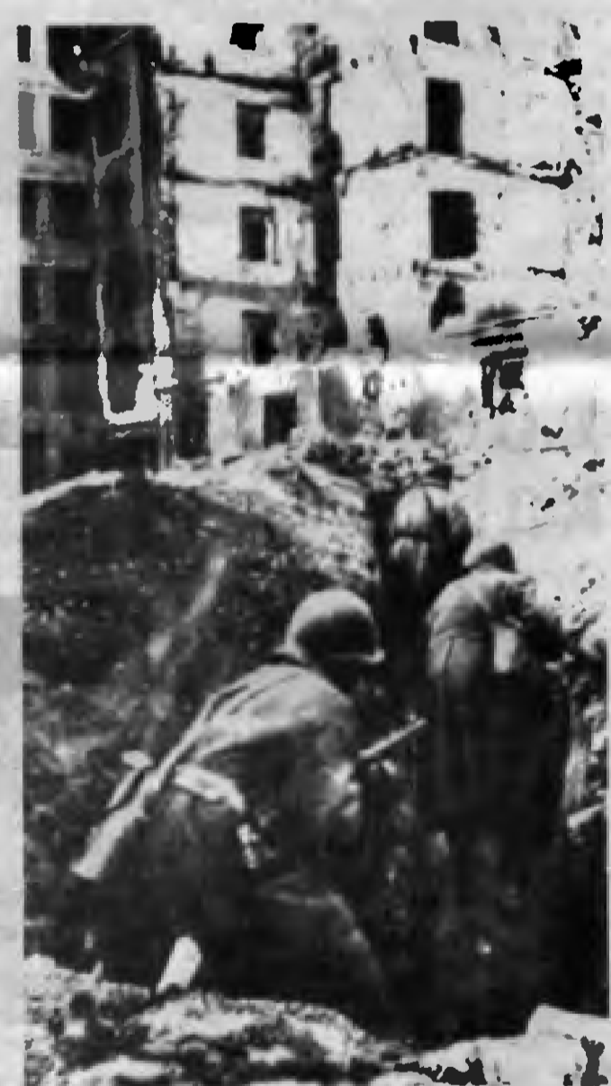
Her bir sokak diş diş savunuldu.