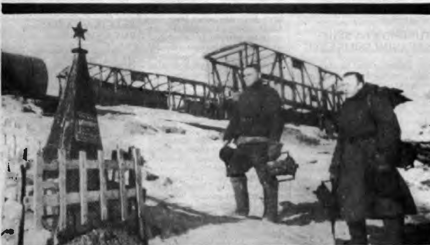
Silâh arkadaşlarının mezarı önünde - Stalingrad 1943

Dı sîng a mîn da panzdeh birin hene... Kunkırın sîng a mîn dı panzdeh cı yî da Wan dı got qey navêje êdî dil ê mîn jı xem ên xwe. Dil ê min dîsa lê dîde, dê lê bide dil ê mîn dîsa... Şewtî jı panzdeh birin ê mîn panzdeh pêt Şikest dı sîng a mîn da panzdeh kêr ên doxreş... Dil ê mîn Nola alek sor lê dîde EW DÊ-LÊ-DE..."