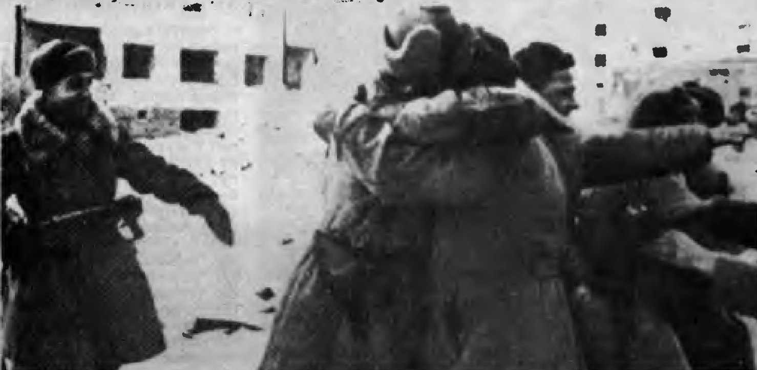
Yüce utkunun sevinciyle kucaklaşan Kızılordu askerleri