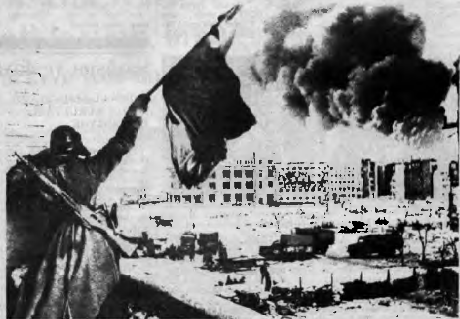
330.000'lik düşman kuvvetlerini esir aldılar.

Kış kampanyası sırasında güçlerin oranı şöyle idi: