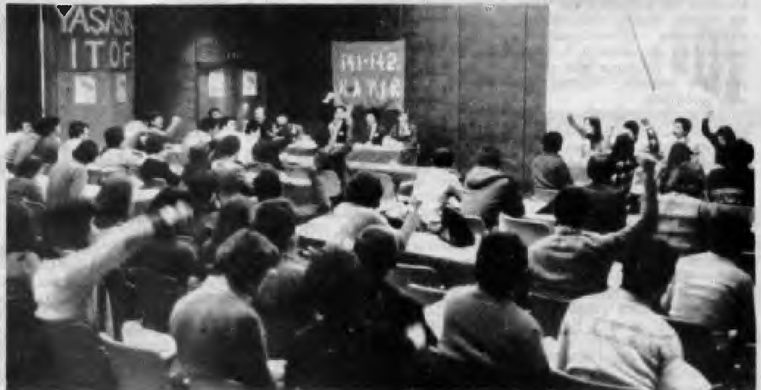
İTÖF 15. Olağan Genel Kurulu'ndan bir görüntü

İngiltere Türkiyeli Öğrenciler Federasyonu (İTÖF)'ün 15. Olağan Genel Kurulu 12 Şubat 1978 pazar günü Londra'da toplandı. İngiltere'nin çeşitli kentlerindeki öğrenci derneklerini ve bireysel üyeleri temsilen gelen delegelerin yanı sıra, çok sayıda gözlemci ve dinleyici de genel kurula katıldı. İTÖF 15. Genel