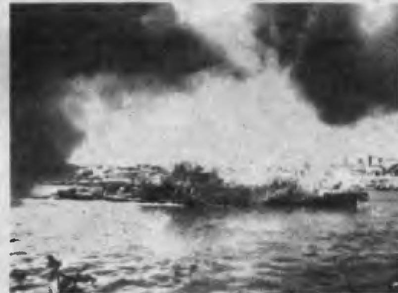
Volga alevler içinde