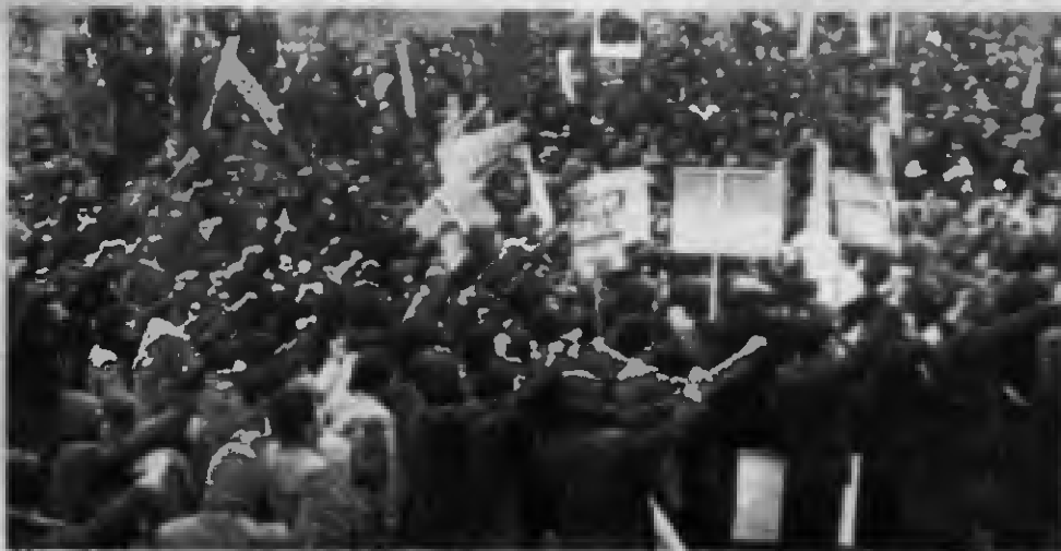
Faşizme karşı savaş andı içilirken

gürlük", "Yaşasın UDC", "DGM'yi ezdik, sıra düzende", "Yaşasın Maden-İş", "Çarklar durdu elimizde, DGM'yi ezdik, sıra MESS'de", "Üsler kalksın, ABD defolsun", "MHP ve Ülkü Ocak-