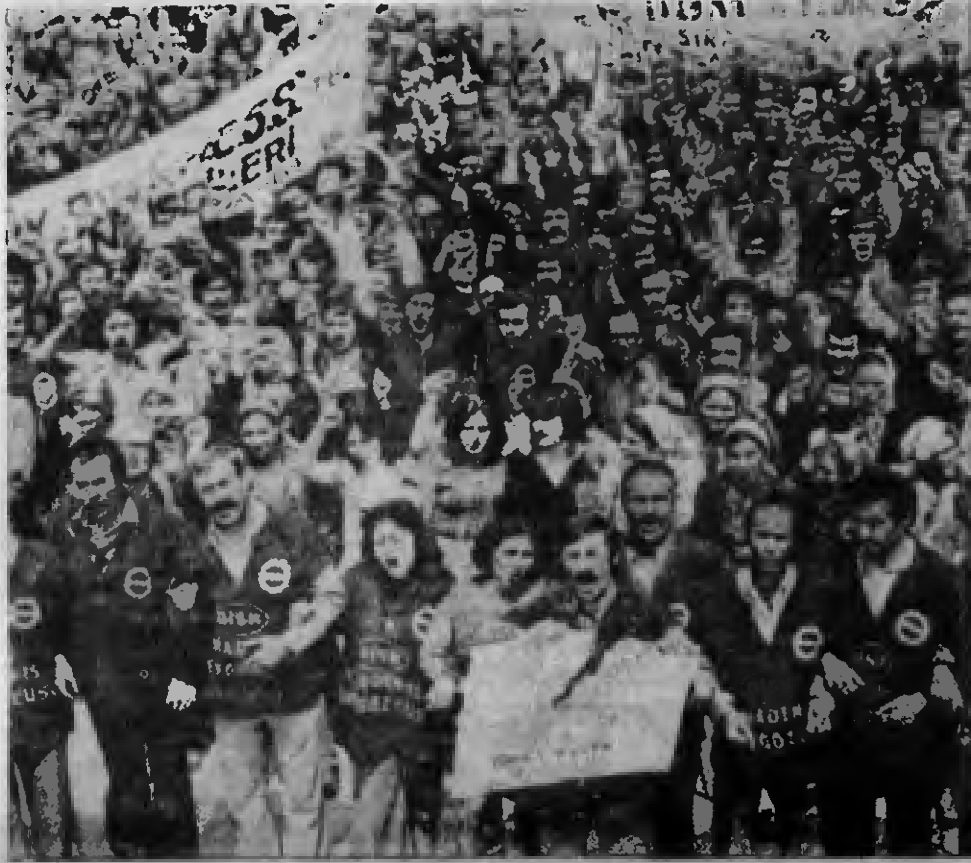
İşçi sınıfımızın savaşı sömürçü de ezip geçecektir!

Türkiye işçi sınıfı, savaş tarihine yeni bir utkuyu daha yazdı. İşbirlikçi-tekeli burjuvaziye, MESS patronlarına karşı direnen Maden-İş üyesi işçiler MESS'i dize getirdiler. İşçiler, 6 Ocak günü üretimi yeniden ele aldılar.