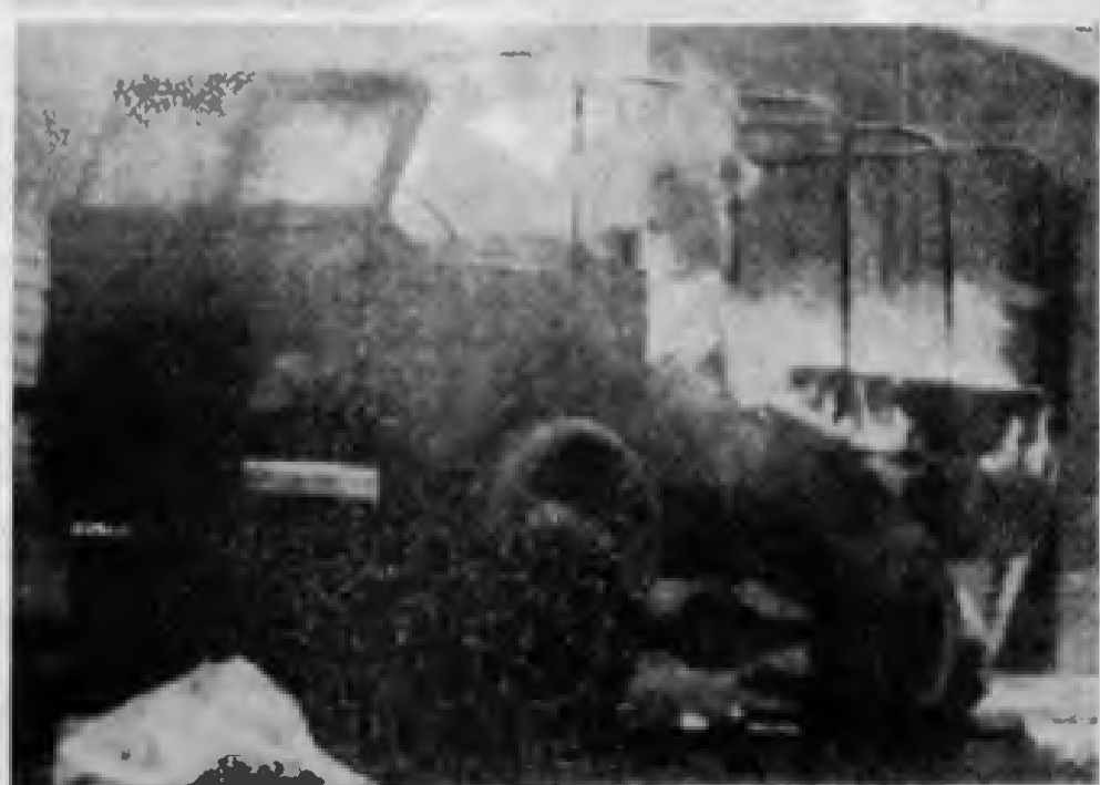
Tunus’da gösteriler sırasında bir askeri araç yanarken...

NATO’nun önde gelen generallerinden, eski Avrupa komutanı Luns bir açıklama yaptı. Luns şöyle diyor: “Eğer bir komünist partisi, biz de demokrasi oyununu(?) oynayacağız, uluslararası sorumluluklarımız(?) saygılı kalacağız, Sovyetler Birliği’nden de gelse(?) saldırıya karşı çıkacağız, basın özgürlüğünü(?) saklı tutacağız, özgür yargı sistemine(?) karşı çıkmayacağız diyorsa, bu demektir ki, o parti artık komünist değildir”. Lenin’in dediği gibi, düşmanın söylediğine kulak vermenin ne denli önemli olduğu açığa çıkıyor. “Çoğulcu demokrasi” yaygaralarıyla, anti-Sovyetizmle gerçekten de komünist olunmaz!